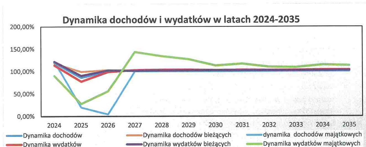
Wykres nr 1: