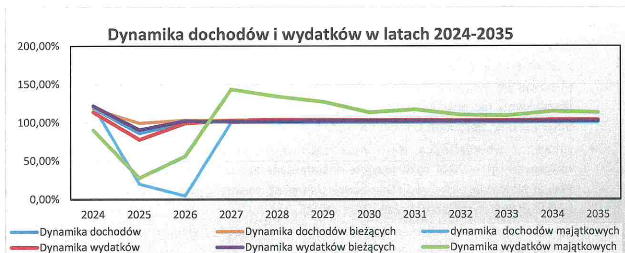
Wykres nr 1: