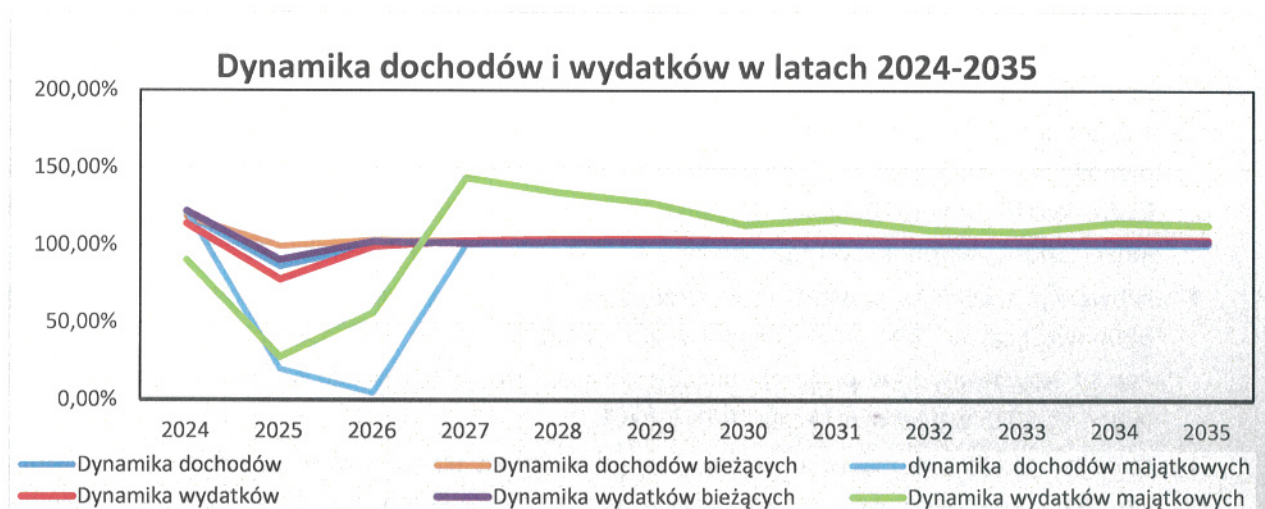
Wykres nr 1: