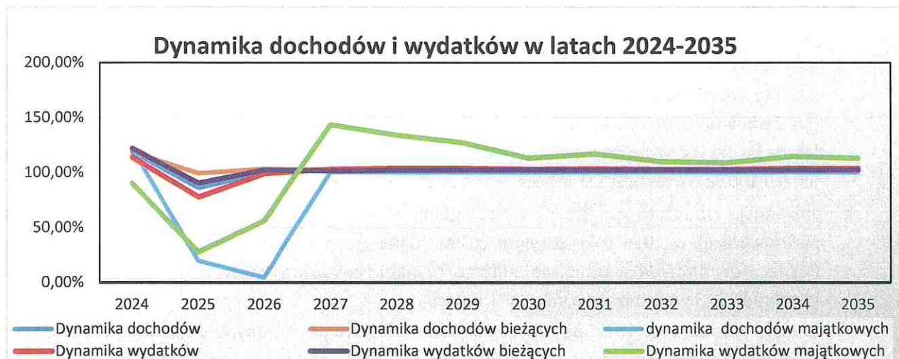
Wykres nr 1: