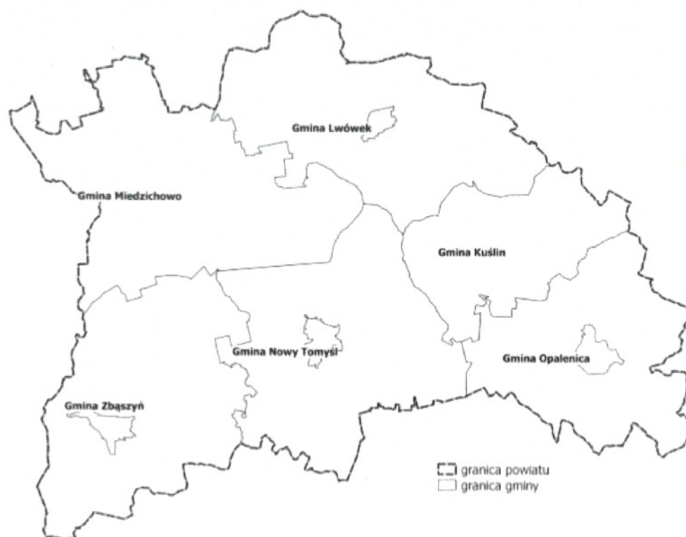
Rysunek 1. Podział powiatu nowotomyskiego na jednostki gminne.