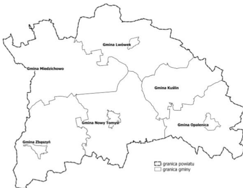
Rysunek 1. Podział powiatu nowotomyskiego na jednostki gminne.