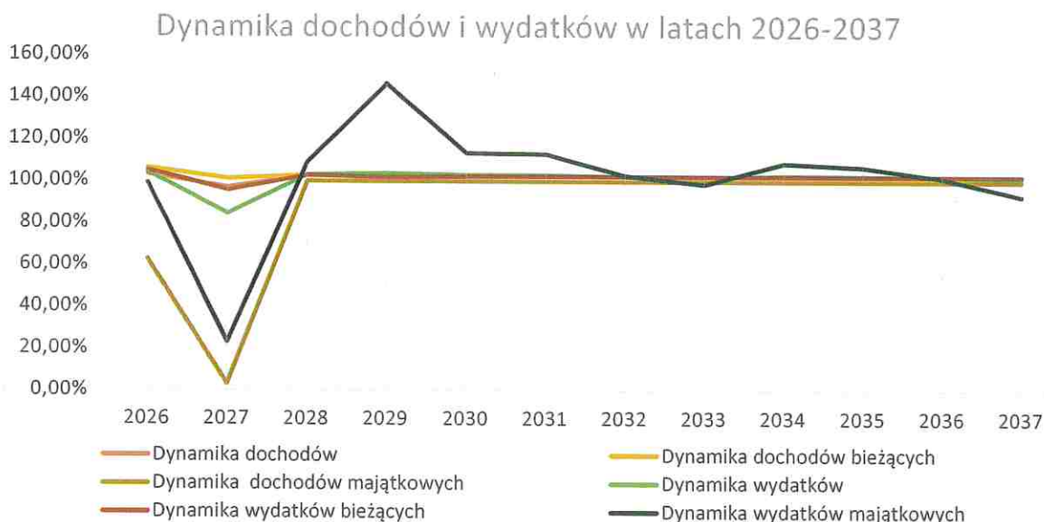
Wykres nr 1: