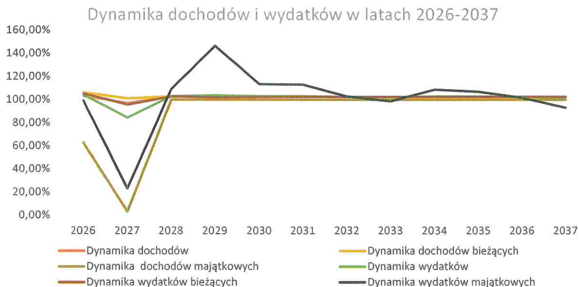
Wykres nr 1: